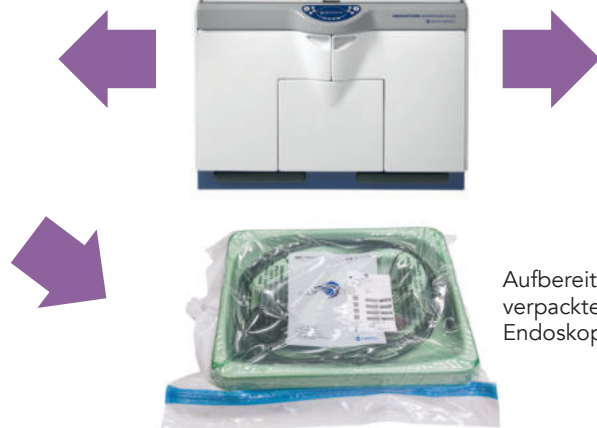
Aufbereitetes verpacktes Endoskop