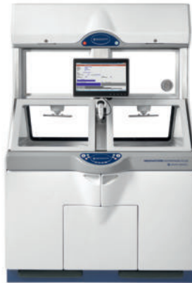
ADVANTAGE PLUS™ Pass-Thru Endoskopaufbereiter