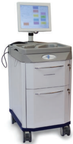
SURESTORE™ Lagerung und Transport